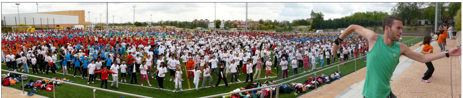
Parque Deportivo de la Cantera de Leganés. Encuentros del 2008

Asociación de Profesorado “ADAL” Código de la cuenta CAIXABANK: ES08 2100 1139 4313 0024 5485