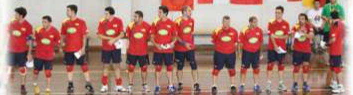
Prácticas del Profesorado con la selección española

*Tchoukball:- Considerado por la UNESCO como "Deporte para la PAZ".