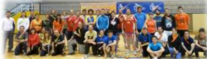
Primer curso de entrenadores con la FITB