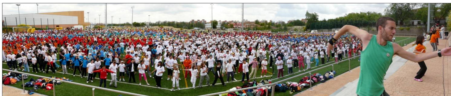
Parque Deportivo de la Cantera de Leganés. Encuentros del 2008

Asociación de Profesorado “ADAL” Código de la cuenta Bankia: ES03 2038 1179 4460 0054 4748.